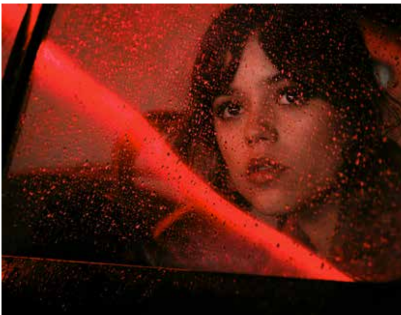
Jenna Ortega como Anima en Hurry up tomorrow”

Traducida en español como “Date prisa mañana” esta película, dirigida por Trey Edward Shults, llega a las salas de cine el 16 de mayo de 2025.