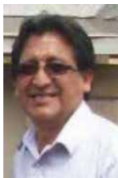
Por FRANCISCO JAUREGUI

El Consulado General del Perú en Phoenix (CGPP) es un órgano del servicio exterior público del MMRREE del Perú, al servicio de las necesidades consulares de la comunidad peruana residente en Arizona. Durante el primer año de gestión tuvo logros importantes, que fueron materia de la primera parte del artículo; sin embargo, como toda institución pública ha tenido algunas limitaciones que abordaré en esta oportunidad. Comenzaré con algunas limitaciones de carácter general, como la falta de una página web del consulado donde detalle toda la información necesaria: nombre de los principales funcionarios, el o los teléfonos de atención, los diversos servicios que se ofrecen