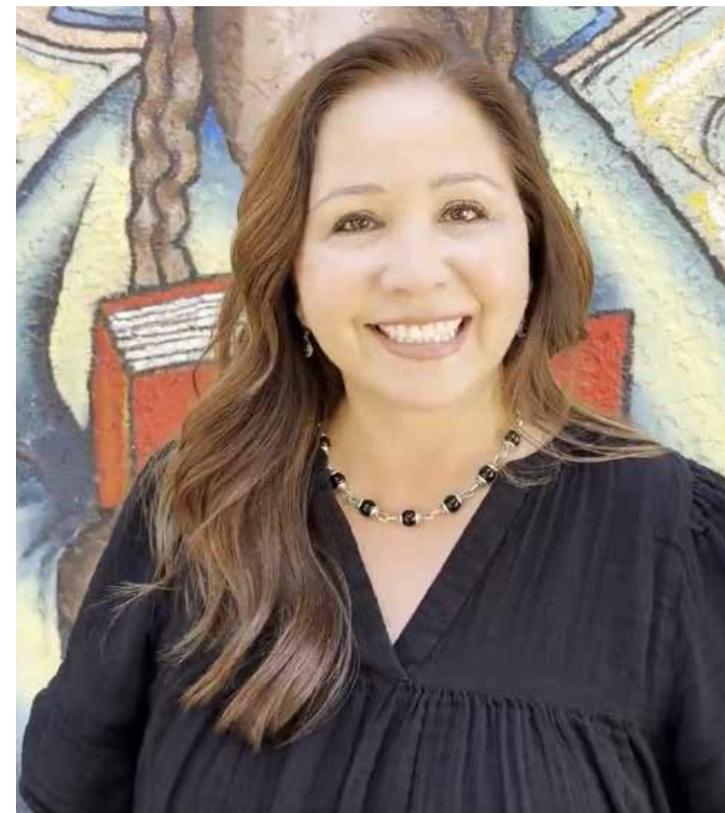
Captura del video difundido en X donde Adelita Grijalva anuncia su candidatura.

"Me siento honrada y, francamente, sorprendida por el gran apoyo que hemos recibido hoy", dijo Grijalva. "Esto es más que una simple campaña. Es un movimiento popular, y es evidente que los arizonenses del sur aún quieren una voz audaz y progresista en el Congreso que luche por las familias trabajadoras y se enfrente al régimen tiránico de Trump".